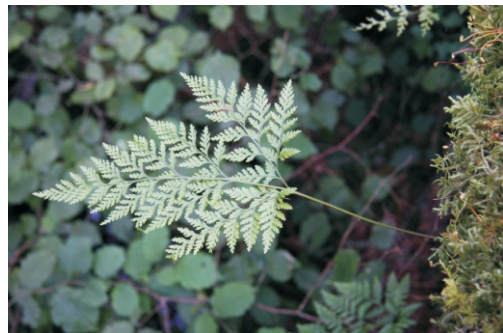
Cabriña ( Davalia canariensis )