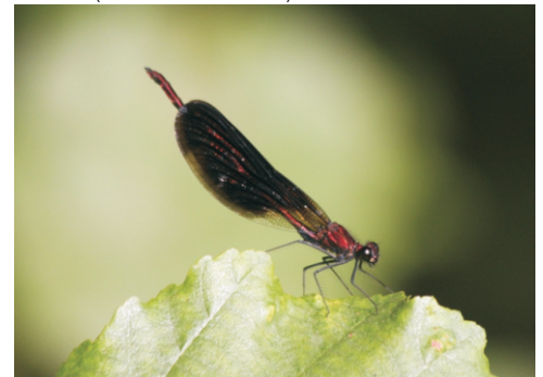
Cabalo do demo, gaiteiro ( Calopteryx haemorrhoidalis )